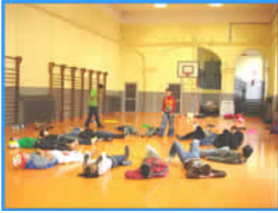
Circostanza all'CTP Parini di Torino

Contesto: la realtà attuale di Torino vede il proliferare di una comunità multietnica dove minori accompagnati e non provenienti da varie nazioni (durante un laboratorio abbiamo contato 16 nazionalità diverse) con difficoltà cercano di integrarsi in un territorio ostile e difficile. L'ostacolo della lingua si unisce a usi e costumi diversi che creano bande spesso rivali di minori per lo più "arrabbiati" verso una società che li rifiuta. Questa rabbia in molti casi si traduce in atti di vandalismo, in abbandono scolastico, in micro delinquenza. Obiettivi: Per favorire l'integrazione sociale e multietnica, per sviluppare l'autostima e potenziare le abilità artistiche dei minori nasce nel 2005 a Torino il Progetto Circostanza che opera in queste diverse aree: